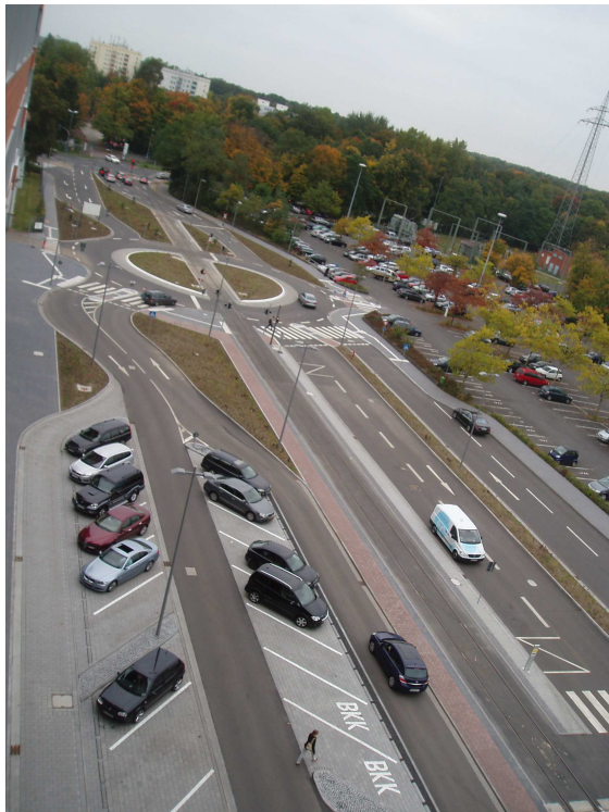
Hauptzufahrt mit Kreisverkehrsplatz

Planung, Ausschreibung und Bauleitung sämtlicher Verkehrsanlagen der Haupt-, Parkhaus- und LKW-Zufahrt nebst deren Beschilderungen, Beleuchtungs- und Signalanlagen sowie Zaun- und Zugangskontrollanlagen für den Industriepark Wolfgang. Hierbei besonders zu nennen, ist die Entflechtung der verschiedenen Verkehrsströme der alten Hauptzufahrt durch die Integration eines neuen Knotenpunktes als Kreisverkehrsplatz innerhalb der neuen Hauptzufahrt mit Integration einer Gleisnebenanlage der Bahn.